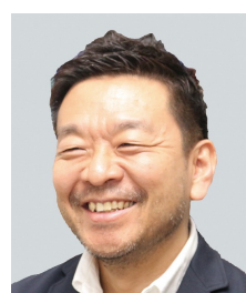
風間 孝/ 中京大学教授

「ジェンダーと暴力」 「性暴力とは」 「セクシュアル・ハラ スメントとパワー・ ハラスメント」