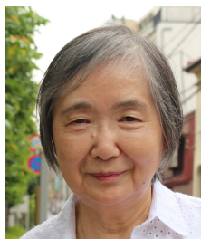
戒能民江 / お茶の水女子大学 名誉教授